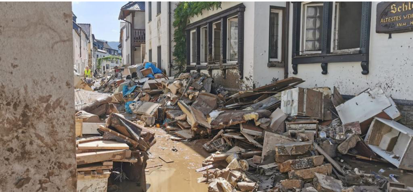
2 Die Überflutungen im Ahrtal im Juli 2021 brachten viele Zerstörungen mit sich. Im Bild ein Eindruck aus Dernau