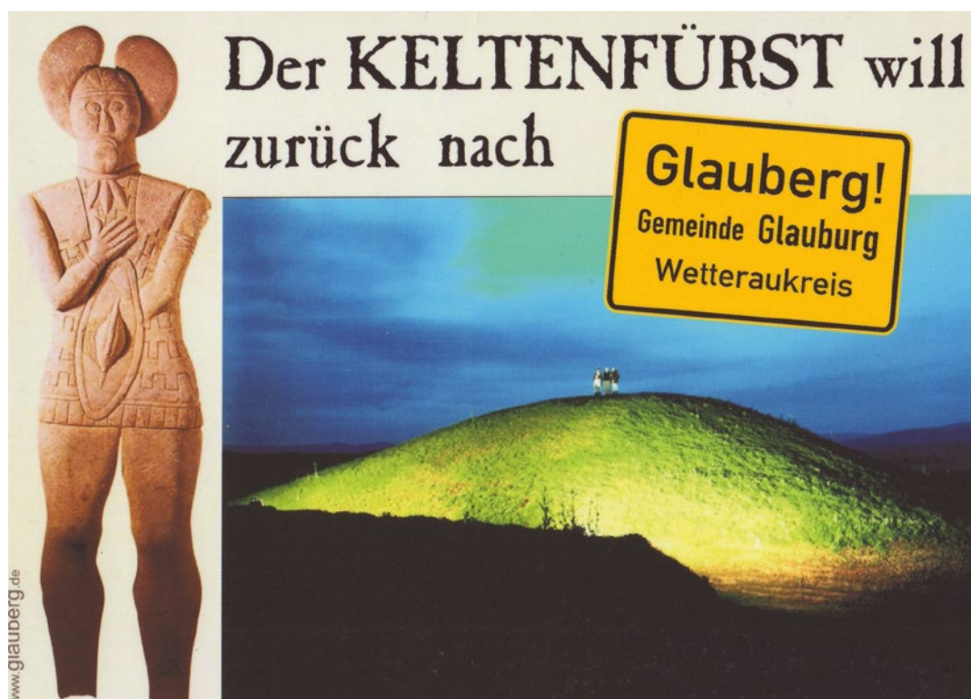
Abb. 5: »Der Keltenfürst will zurück« Postkarte der regionalen Bewegung Grafik: Heimat- und Geschichtsverein Glauburg e. V.

Es formierte sich eine breite Protestbewegung, die ihren Anspruch auf den Verbleib der Funde am Glauberg vehement öffentlich artikulierte.