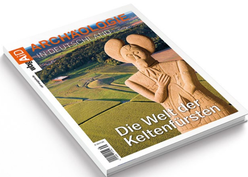
Abb. 9: 30 Jahre Statue des ›Keltenfürsten vom Glauberg Anlässlich des Jubiläumsjahrs gibt die Keltenwelt am Glauberg ein Sonderheft der Archäologie in Deutschland heraus. Cover: Herder Verlag, wbgAiD