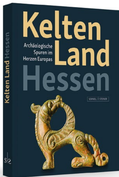
Abb. 7: ›Kelten Land Hessen‹ Begleitpublikation zum ersten hessenweiten Archäologiejahr 2022 Layout: K. Pfeil, Büro für visuelle Gestaltung, Mainz

Obwohl die Museumseröffnung 2011 von einem medialen Skandal überschattet wurde – ein Sicherheitswachmann aus dem rechtsextremistischen Umfeld posierte vor der Fürstestatue –, schmälert dies nicht die Tatsache, dass der Neubau neue Maßstäbe im Umgang mit archäologischen Großfunden setzte. Vielmehr etablierte sich der Glauberg dauerhaft als Ort wissenschaftlich fundierter Präsentation und Vermittlung: Die unmittelbare Nähe von Grabungsareal, Ausstellung und Forschung schuf ein dynamisches Modell, in dem neue Erkenntnisse zeitnah in die Vermittlungsarbeit integriert werden können.