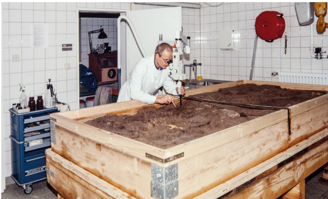
Abb. 3: ›Indoor-Ausgrabung‹ Die Freilegung des Grabes des ›Keltenfürsten‹ unter Laborbedingungen

Erst ab den 1980er-Jahren wurde die Forschung auf und um den Glauberg von der Landesarchäologie – letztlich aber auch auf Betreiben des Heimat- und Geschichtsvereins Glauberg e.V. – wieder gezielt aufgegriffen. Unter Leitung des damaligen Landesarchäologen Dr. Fritz-Rudolf Herrmann und unter örtlicher Leitung des Grabungstechnikers Norbert Fischer führte die hessische Bodendenkmalpflege ab 1985 nach wissenschaftlichen Standards dokumentierte archäologische Untersuchungen durch, die sich zunächst auf die Befestigungsanlagen des Plateaus