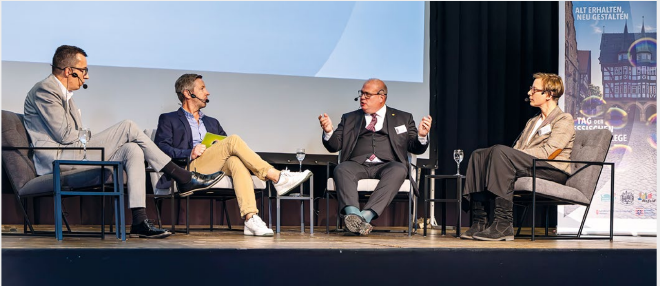
Abb. 1: Podiumsdiskussion Vertiefung der Vortragsthemen

Anlässlich des 50-jährigen Jubiläums der Auszeichnung Alsfelds als Europäische Modellstadt für den Denkmalschutz durch den Europarat 1975 fand dort der 44. Tag der Hessischen Denkmalpflege unter dem Motto ›Alt erhalten – Neu gestalten‹ am 13. September 2025 statt.