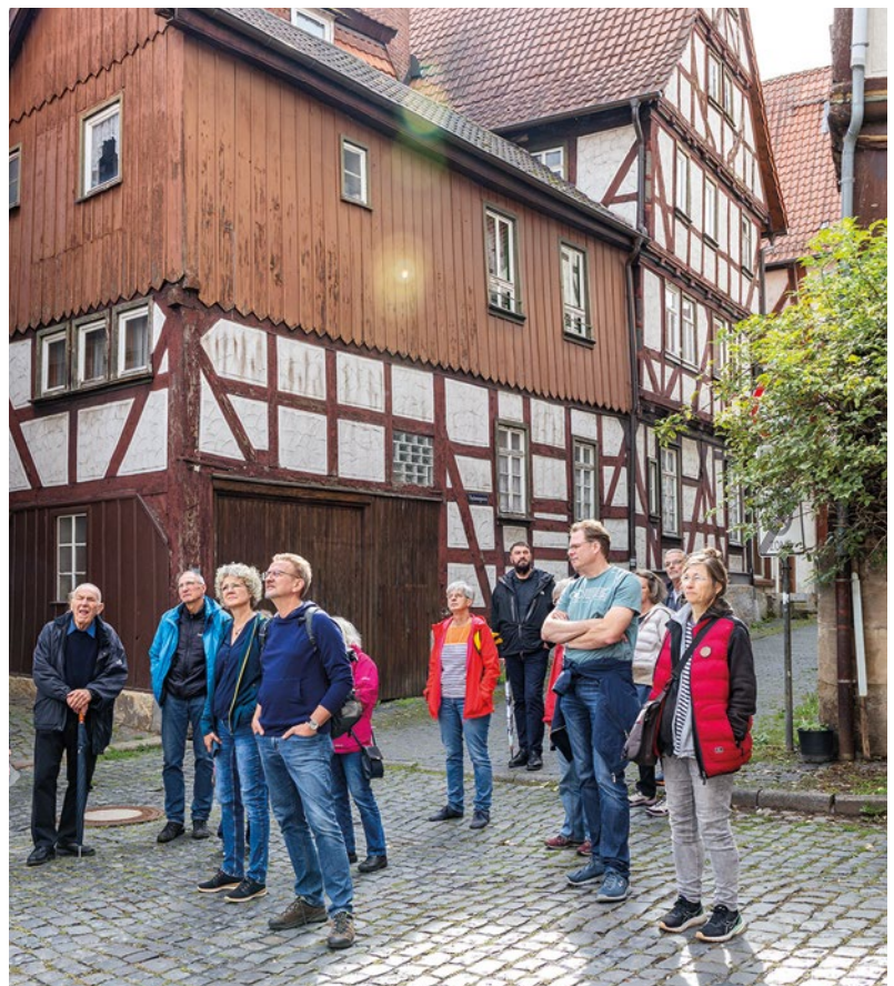
Abb. 2: Begleitprogramm Führungen zu den Beispielen der Modellstadt