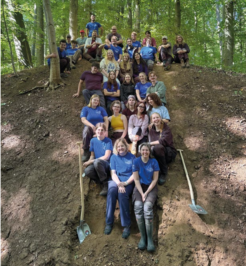
Abb. 1: Wallschnitt am Enzheimer Kopf

Das Team der Sommerakademie 2025 vor dem abgetrepten Schnitt durch den ältereisenzeitlichen Wall