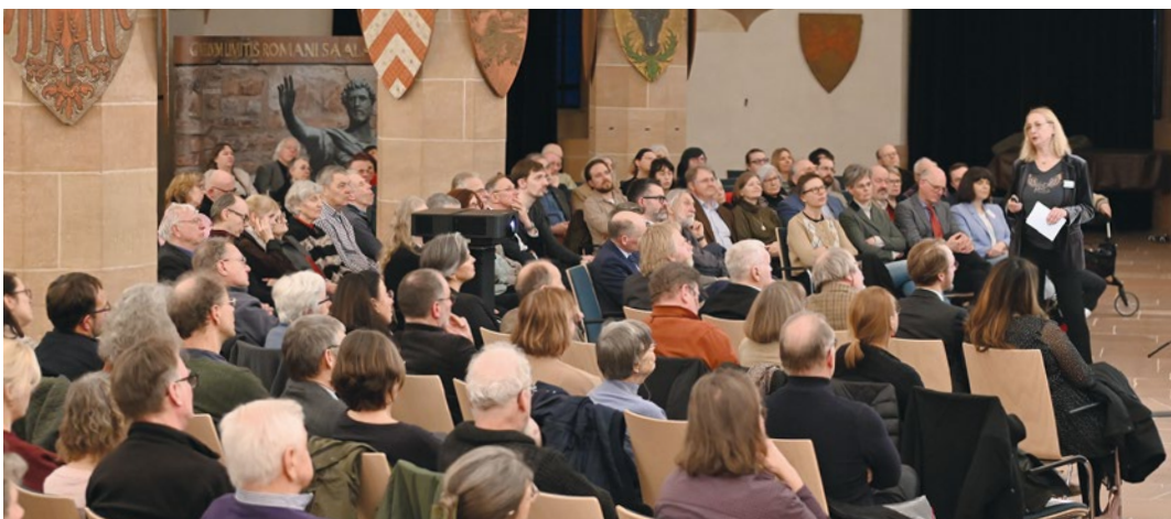
Abb. 2: Großes Interesse an der Schlossgeschichte

Im historischen Fürstensaal fanden sich 200 Gäste ein, um sich über die Vorgängerbauten unter dem heutigen Schloss zu informieren.