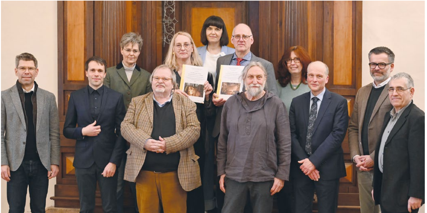
Abb. 1: Neue Publikation zum Landgrafenschloss Sowohl die Publikation selbst als auch die Buchvorstellung konnten nur als Gemeinschaftswerk gelingen.