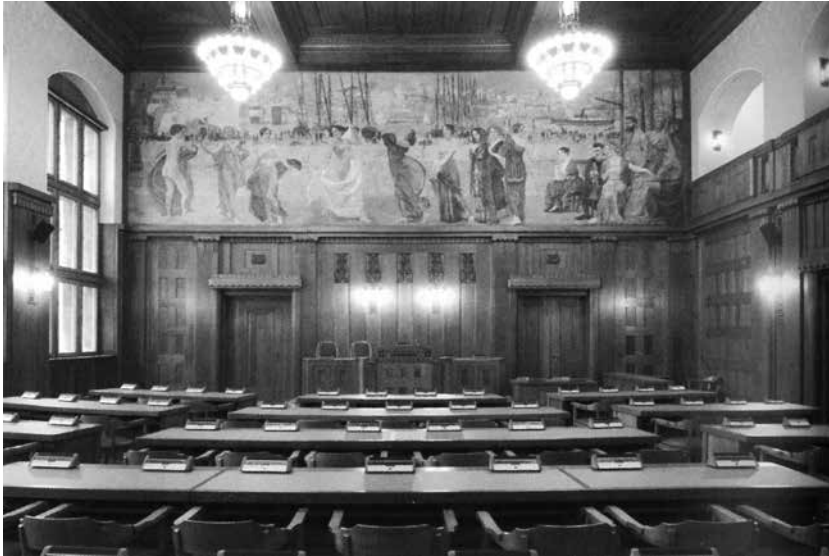
Abb. 5: Der Stadtverordnetensaal des Neuen Rathauses in Chemnitz mit Klingers Wandbild „Arbeit = Wohlstand = Schönheit“ nach Restaurierung des Saals, 2011 (Dietrich 2020, 688)

Hinter der schmalen Vordergrundbühne breitet sich ein zeitgenössisches Hafenpanorama als Hinweis auf Arbeit und Wohlstand aus. Die Kombination dieser beiden Ebenen wurde von der Kritik nicht nur positiv aufgenommen. Dietrich resümiert: „So individuell und neuartig die Bildaussage in ihrer Konsequenz ist, so konventionell ist das Figurenprogramm des Gemäldes. Zwar war die Darstellung von Musen und Göttern ungewöhnlich für einen Stadtverordnetensaal des Kaiserreichs. Sie hatte jedoch ihr Vorbild und damit Legitimation in den höfischen Festsaaldekorationen des Barock, sollte doch auch der Chemnitzer Saal für Festveranstaltungen genutzt werden.“ (373) Zwei Monate vor Ende des Ersten Weltkriegs eingeweiht, zeigt das Bild auch, dass Klinger aus seiner Zeit gefallen war. Oder positiv formuliert: Das Rathausbild steht am Ende einer ikonografischen Entwicklung, die um 1900 noch einmal vehement aufgeblüht war.