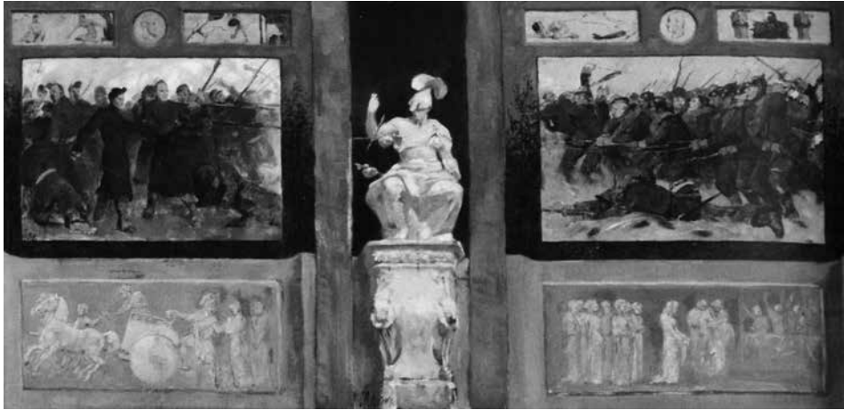
Abb. 2: Max Klinger, Allegorie auf den deutsch-französischen Krieg 1870/71, Entwurf für ein Wandbild im großen Saal des Schlosses Schönfließ bei Berlin, 1878 (Dietrich 2020, 658)

auf die Form des wandfüllenden Monumentalgemäldes und auf die Malerei als Raumkunst. Dietrich nennt sie daher treffend „antizipierte Wandbilder“ (84).