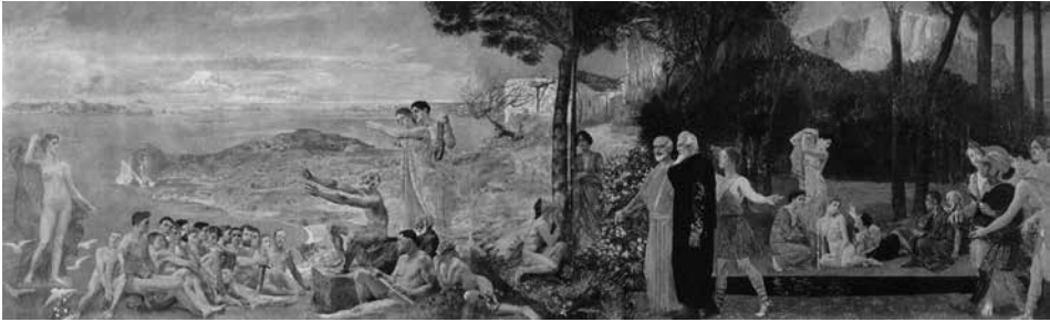
Abb. 3: Max Klinger, Die Blüte Griechenlands , 1909, Wandbild in der Aula der Universität Leipzig (Kriegsverlust), nach einer farbigen Reproduktion, vertrieben vom Verlag E.A. Seemann, Leipzig (Dietrich 2020, 678)

licher Entwicklung“ dem Sündenfall und der Leibfeindlichkeit des Christentums gegenüberstellte (186). Im Zentrum der Gestaltung wäre die Skulptur einer schreitenden Muse gestanden, für die sich Klinger kein geringeres Werk als die Nike von Samothrake im Louvre als Vorbild nahm, die erst 1884 ihren prominenten Platz bekommen hatte. Doch Klinger veröffentlichte den Entwurf zu Lebzeiten nicht, auch weil er Sorge vor Plagiaten hatte.