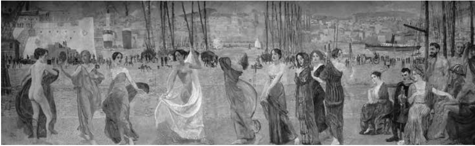
Abb. 4: Max Klinger, „Arbeit = Wohlstand = Schönheit“, 1918, Wandbild im Stadtverordnetensaal des Neuen Rathauses in Chemnitz (Dietrich 2020, 687)

Die klar strukturierte Gliederung des Buches lässt auch bei diesem bislang wenig beachteten Werk Klingers nichts zu wünschen übrig. Es wird die Entwicklung des Auftrages ebenso quellenreich und detailliert dargelegt wie die des allmählich gewachsenen Bildprogramms, dessen Stärken und Schwächen vorgestellt werden. Diese Untersuchung schließt mit der Rezeption und mit den wenigen selbstkritischen Äußerungen Klingers ab, der mit der Gesamtwirkung des Raumes, den er fertig vorgefunden und auf den er sich nicht gänzlich eingelassen hatte, nicht zufrieden war.