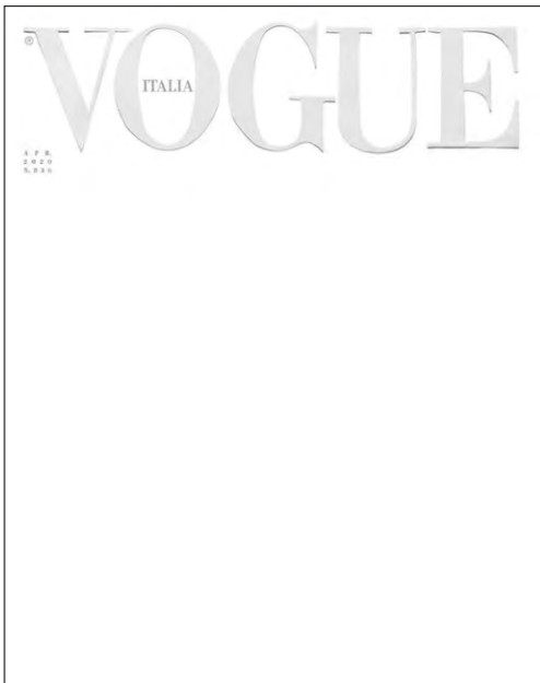
4 Cover der Vogue Italia, April 2020.

«vor allem Respekt. Das Weiß ist Wiedergeburt, ist das Licht nach dem Dunkel, ist die Summe aller Farben. Das Weiß ist die Farbe der Uniform derjenigen, die uns das Leben gerettet haben, während sie das eigene riskierten. [Weiß] ist Zeit und Raum zum Nachdenken. Auch, um stumm zu bleiben. [...]. Vor allem: Weiß ist keine Kapitulation, es ist eher eine leere Seite, die es zu beschreiben gilt». 21