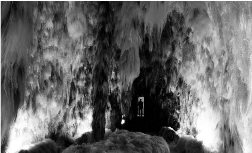
3 Hrafnhildur Arnardóttin (Shoplifter), Chromo Sapiens , Installationsansicht, Island Pavillon, Venedig Biennale 2019.

seiner Sehorgane verändernden (Farb-)Wahrnehmungen, besitzen somit nicht nur eine ästhetische und immersive, sondern aufgrund der radikalen Verलusterfahrung auch eine (individual-)ethische und existentielle Prägnanz.