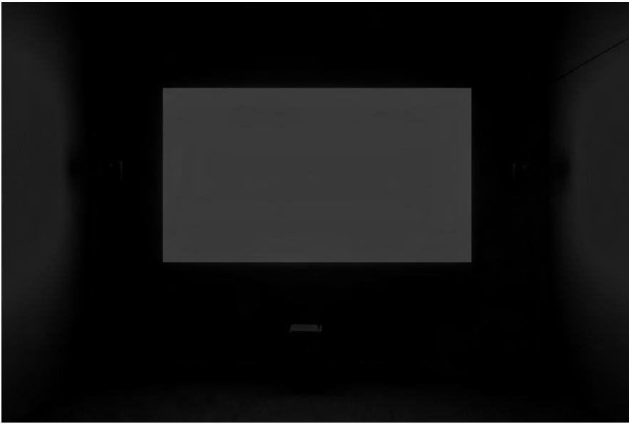
2 Derek Jarman, Blue , 1993, 35mm Film, Dauer 79 Minuten, Präsentationsansicht, Tate London 2014.