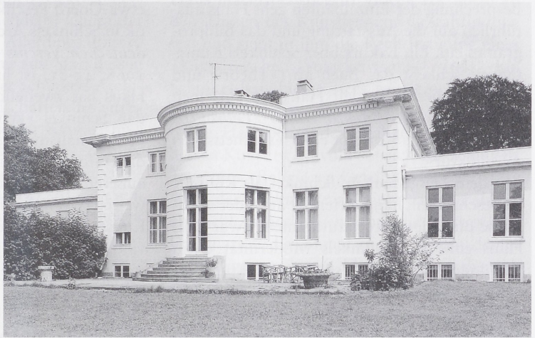
Abb. 2 Altona, Landhaus Godeffroy, Christian Fre- derik Hansen 1792 (Denkmalschutzamt Hamburg)

vorgegangen sind. Uns Zeitgenossen einer gar nicht mehr bürgerlichen Epoche weht daraus ein Hauch jenes höheren Lebensgefühls an, das sich im frühen 19. Jh. noch ein schickliches Ambiente zu gestalten wußte. So liest sich Bisseggers schönes Buch nicht nur als die