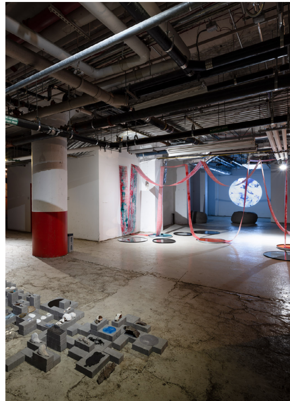
Abb. 2 Keren Anavy, Archipelago & 365 und Blood Will Turn into Water , multimediale Installationen, u.a. Stein, Holz, Wasser, Muscheln, synthetische Materialien, verschiedene Größen, BioBAT Art Space Brooklyn (NY), Dark Space.

18.000 m 2 Ausstellungsfläche, mit einem im White-Cube-Stil inszenierten Eingangsbereich (Abb. 1) sowie einem weitläufigen Dark Space (Abb. 2) im hinteren Teil