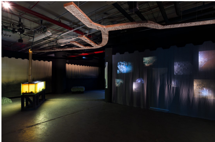
Abb. 5 Scope Collective, CHANNEL , 2025, multimediale Installation, u.a. Wassertanks, Gowanus-Sediment, Wasser, Mikroorganismen, Videoinstallationen, BioBAT Art Space Brooklyn (NY), Dark Space.

mitteln. Darüberhinaus bleiben Art-Science-Projekte wie CHANNEL aber vorerst ‚Work in Progress‘, denn ihre tatsächliche Transformationskraft in Bezug auf die Potenziale, Risiken und Grenzen neuer Ökologiegefüge muss erst noch weiter untersucht werden. Nicht zuletzt hängt diese natürlich auch von der Bereitschaft der Gesellschaft ab, derartige künstlerische Experimente in der Lebenspraxis aufzugreifen und weiterzuentwickeln.