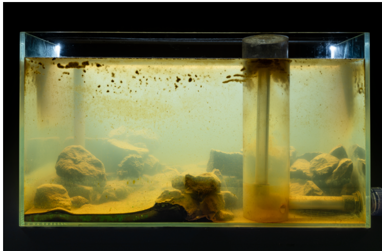
Abb. 4 Scope Collective, CHANNEL , 2025, multimediale Installation, u.a. Wassertank, Gowanus-Sediment, Wasser, Mikroorganismen, BioBAT Art Space Brooklyn (NY), Dark Space.

ein eigenes technoökologisches System, das es zu entdecken galt (Abb. 4). Denn erst bei genauerem Betrachten entfalteten diese Mikrokosmen ihre pittoresk-ästhetischen Qualitäten in Form von unterschiedlichen Texturen, vielfältigen bizarren Strukturen oder entweichenden Gasen als Ausdruck des Stoffwechsels und der Lebenszyklen der darin beheimateten Kleinstlebewesen. Als Bioinkubatoren dienten die Tanks nicht nur als Teil der Inszenierung, sondern wurden von Scope Collective auch zur Erhebung von Daten über die Entwicklung von Mikroben unter kontrollierten Bedingungen genutzt. Über diese Forschungen informierten Videoinstallationen, die unter anderem Fragen nach einem gleichermaßen nachhaltigen wie ethischen Umgang mit solchen Lebensformen aufwarfen. Auf diese Fragen referierte auch eine über der Tankinstallation montierte betonfarbene Skulptur in Gestalt des Kanalgrundrisses – sozusagen ein visueller Fingerzeig auf die Pläne der Regierung, den Kanal mit Beton zu versiegeln und damit das sich neuentwickelnde Ökosystem zu begraben (Abb. 5). Die Skulptur war so angebracht, dass sie sowohl über der Installation als auch über den Besucher*innen zu schweben schien und aufgrund ihrer Größe und ihres Umfangs den Eindruck erweckte, als ob sie jederzeit herabstürzen und einem Sargdeckel gleich die Tanks mit den Mikroben ebenso wie das Publikum erschlagen könnte. Dies kann als Hinweis darauf gelesen werden, dass Mikroorganismen und Menschen zwar unterschiedliche Nischen ein- und