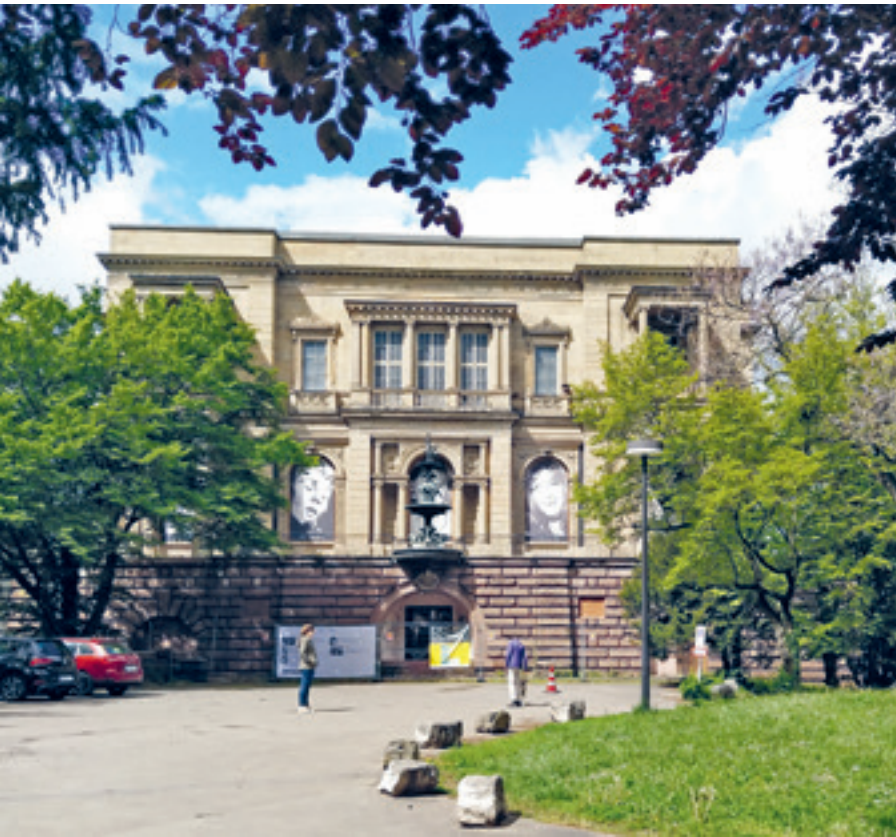
2 Gartenansicht der Villa Berg im Jahr 2021.

Reiff: Durch den Verein „Aufbruch Stuttgart“ um Fernsehmoderator Wieland Backes wurde unter Pressebeteiligung intensiv die im Grundsatz denkmalgerechte Variante diskutiert, das Interim nahe der Oper zu errichten und als dauerhafte Spielstätte beizubehalten. Damit hätte sich der Einbau einer Kreuzbühne im Denkmal erübrigt. Allerdings sollte das Interim anstelle des Katharinenstifts, einem traditionsreichen ebenfalls denkmalgeschützten Schulbau entstehen. Ideen und Skizzen zu diesem Projekt vom renommierten Architekten Arno Lederer lagen vor. Plötzlich zog die Opersanierung noch sehr viel mehr öffentliche Aufmerksamkeit auf sich. Das führte dann zum Beteiligungsprozess.