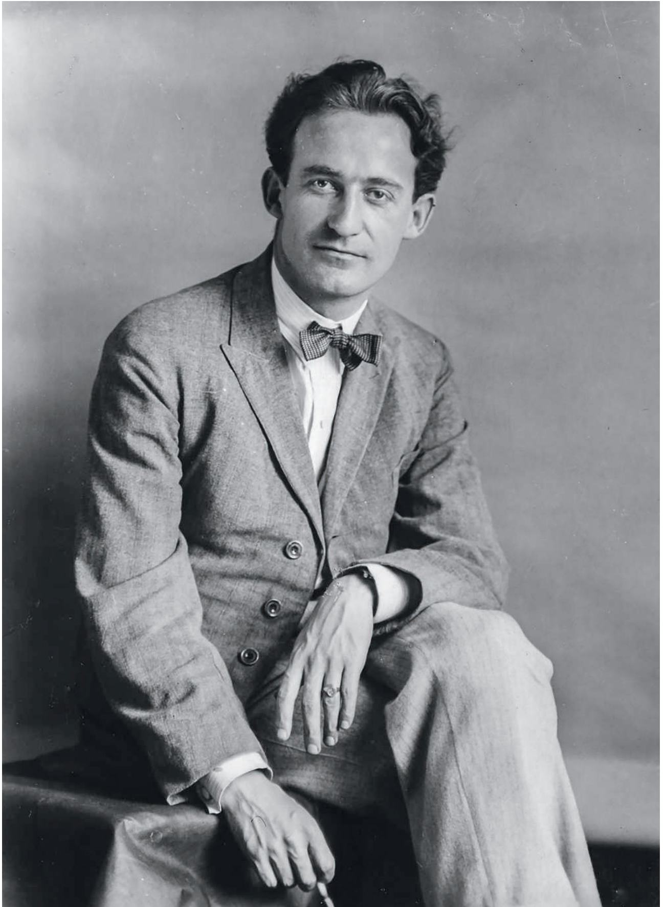
Berenice Abbott, Gotthard Jedlicka , Paris, vers 1928