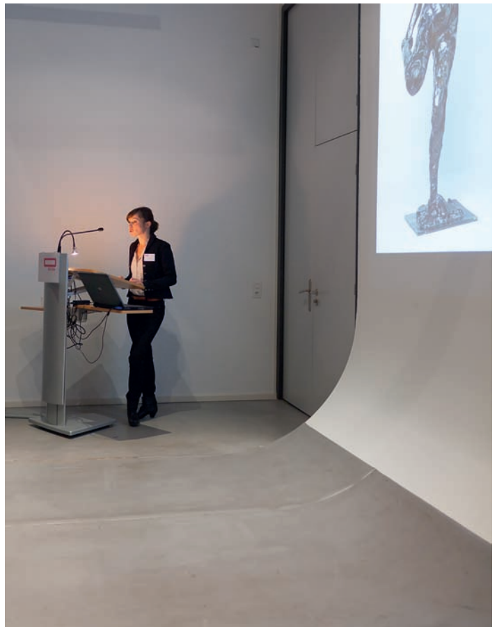
Présentation de résultats de recherche au colloque international «Authentizität in der bildenden Kunst der Moderne»