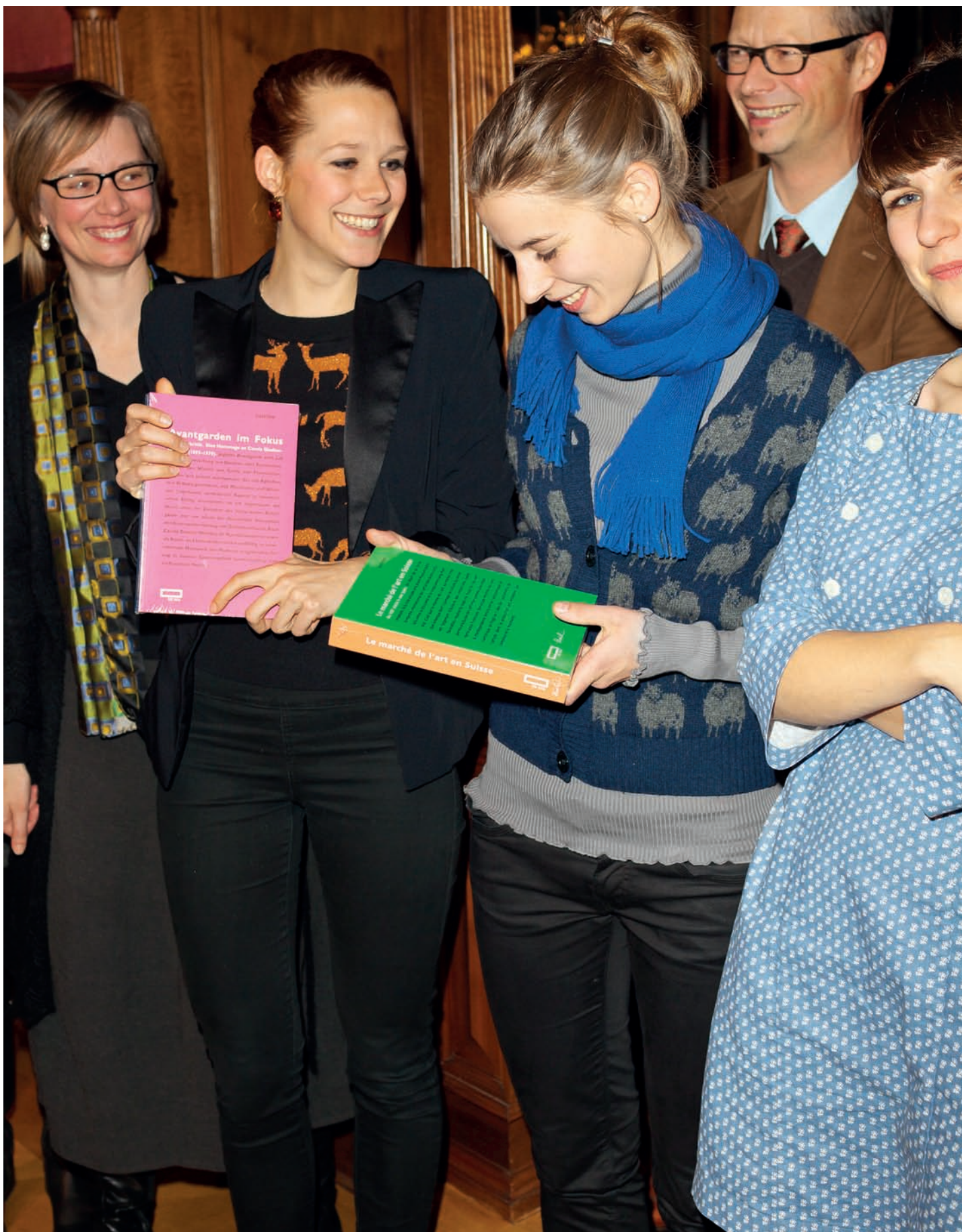
SIK-ISEA présente ses nouvelles publications dans le cadre de la remise du Prix d'encouragement à la recherche en histoire de l'art, délivré par la Fondation Alfred Richterich et l'Association suisse des historiennes et historiens de l'art (ASHHA)