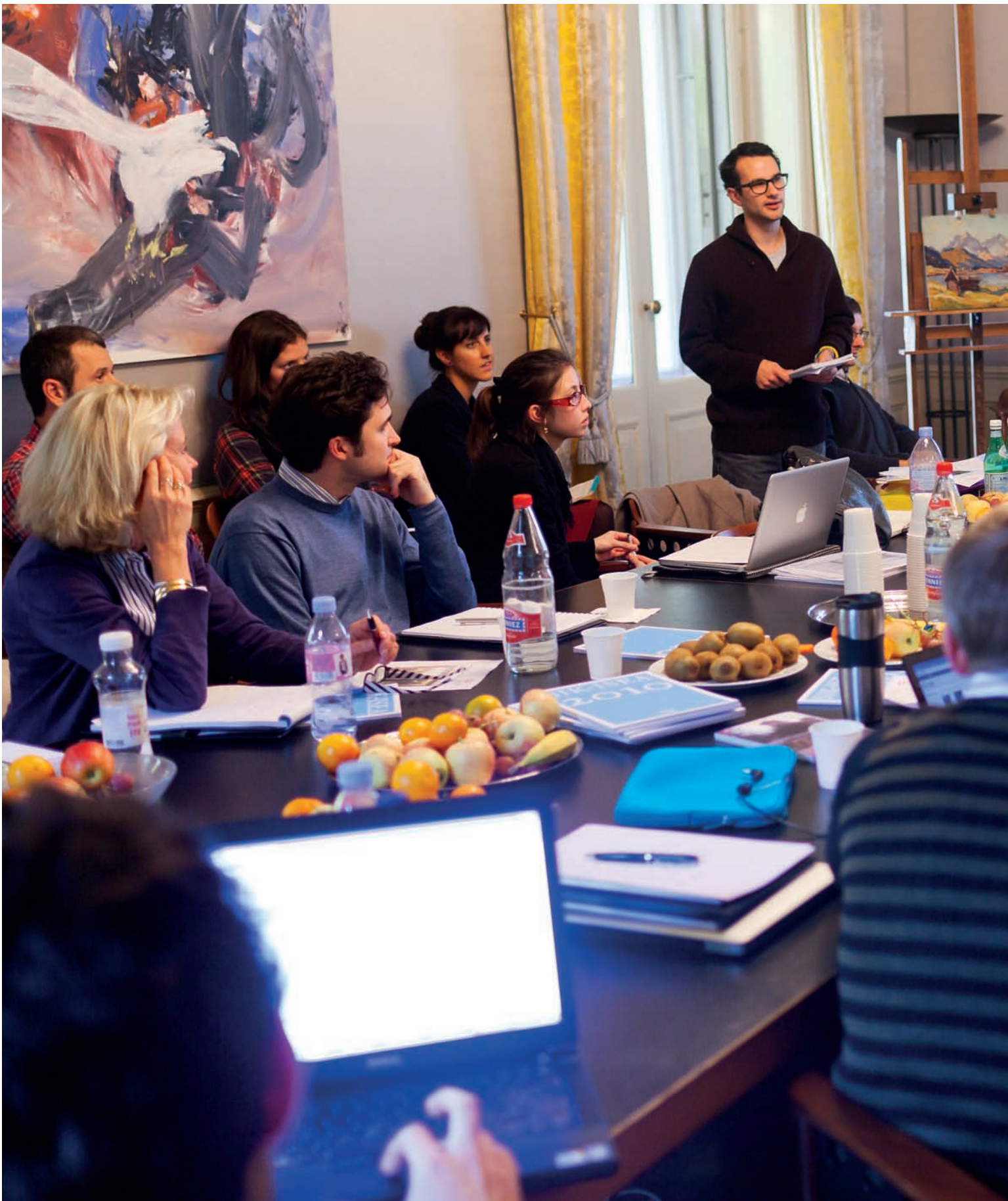
SIK-ISEA a organisé un module de formation de l'«Executive Master in Art Market Studies» de l'Université de Zurich